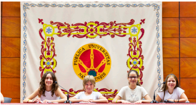
Ponencia inaugural en el Encuentro Final de Escuelas Solidarias, en el Aula Magna de la Universidad Pública de Navarra.