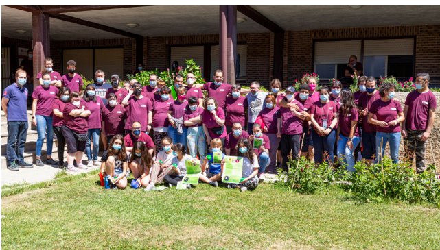
Con las personas usuarias del Centro Ocupacional de Tasubinsa en Tafalla tras la charla dada por una representación de la clase.