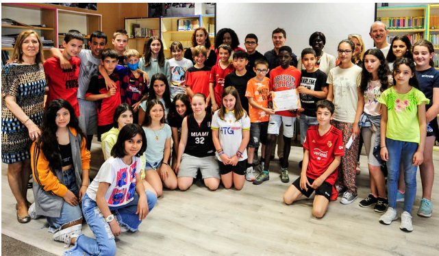
Acto central y diploma con la cúpula del Departamento de Políticas Migratorias (Consejero, Directora General y D.ª de Servicio) y la asociación Flor de África.