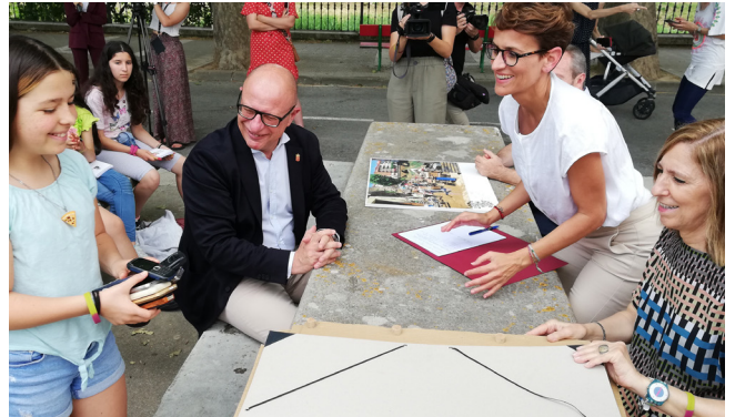
Recogiendo los móviles aportados por la Presidenta de Navarra ante la atenta mirada del Consejero de Educación y nuestra Directora; detrás, el Alcalde de Tafalla.