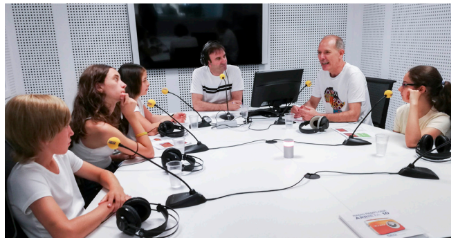
Entrevistas en prensa, radios y televisiones. En la imagen, en los estudios de la Cadena SER en Pamplona.