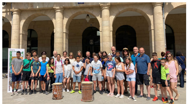
Inauguración de la Fiesta: Directora, la clase y familiares con el Alcalde, ediles, ONGD y asociaciones participantes.