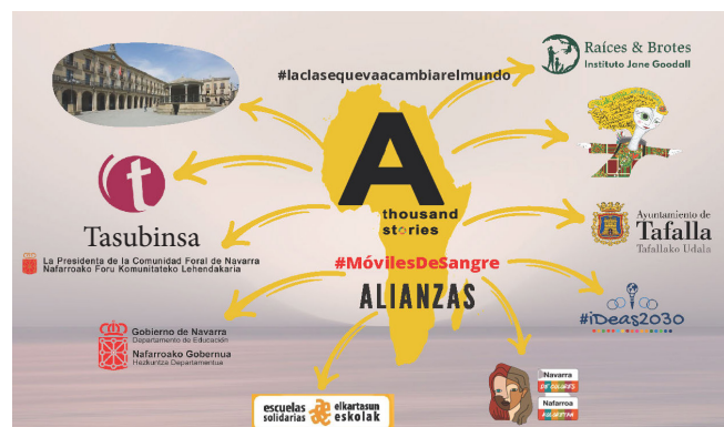
Red de alianzas tejida durante la buena práctica. ( Ampliar imagen )