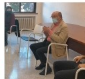
Juan Cruz Allí Ex Presidente del Gobierno de Navarra