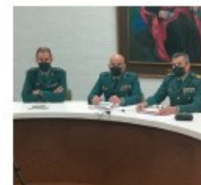
Mandos de Guardia Civil