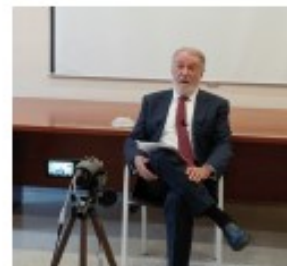
Jaime Mayor Oreja Ex Ministro del Interior y Eurodiputado