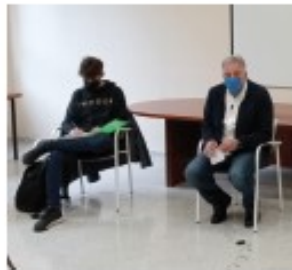
Joseba Astrón Ex Alcalde de Pamplona