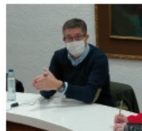
Patxi López Ex Lehendakari y Presidente del Congreso