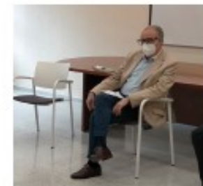
Miguel Sanz Ex Presidente del Gobierno de Navarra