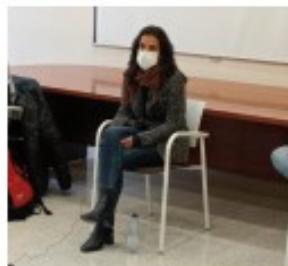
Sara Buesa Víctima de ETA

Las siguientes personas estuvieron presentes físicamente en el aula con el alumnado: