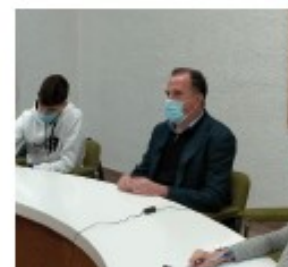
Carlos Iturgalz Presidente del PP vasco